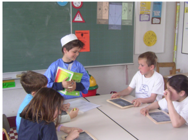
Kinderen aan de slag in CLIM